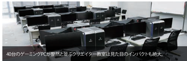
40台のゲーミングPCが整然と並ぶクリエイター教室は見た目のインパクトも絶大。

同校はクリエイター指向の高まりに合わせ、根本的なデザイン教育の増強を検討するなど、時代に合わせたカリキュラムと学習機材のブラッシュアップを続けていく。