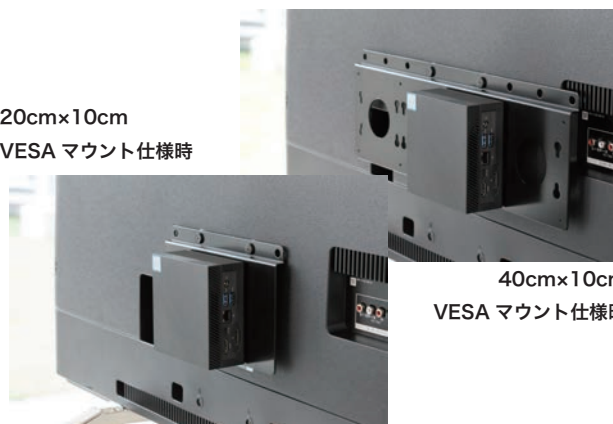
40cm×10cm VESA マウント仕様時